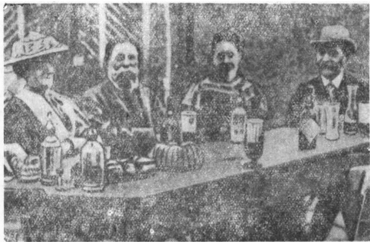
1893年第二国际苏黎世大会。图为德国社会民主党人在苏黎世近郊合影，左起第二人是恩格斯，左起第三、四人是倍倍尔夫妇。

1893年8月，恩格斯在唯一亲自参加的第二国际第三次代表大会上发表了演说，他一方面豪情满怀地回顾了当时国际共产主义运动的大好形势，指出：“自从马克思和我加入运动，在‘德法年鉴’上发表头几篇社会主义的文章以来，已经整整五十年过去了。从那时起，社会主义从一些小的宗派发展成了一个使整个官方世