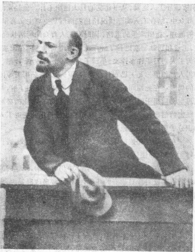
1920年5月列宁在斯维尔德洛夫剧院广场向出发到前线去 反击白匪军的士兵讲话