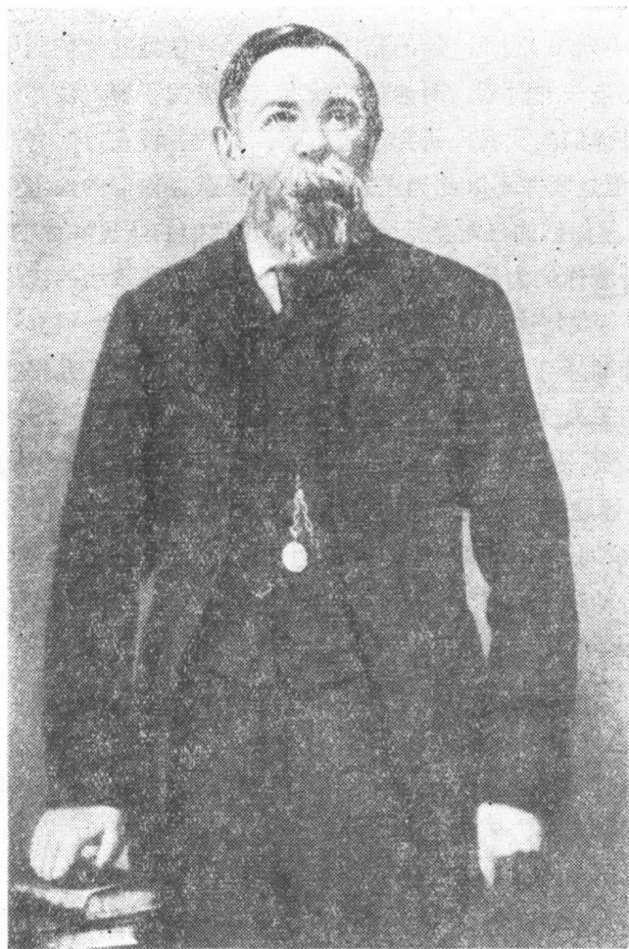
弗里德里希·恩格斯(1891年)