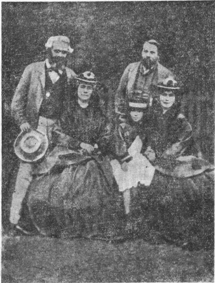
卡·马克思、弗·恩格斯和马克思的女儿燕妮、爱琳娜和劳拉