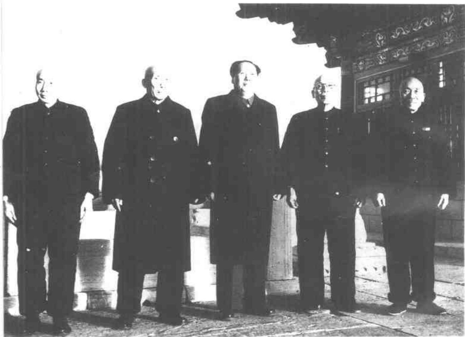
毛泽东和邹普勋(左一)、李漱清(左二)等的合影。(1952年)