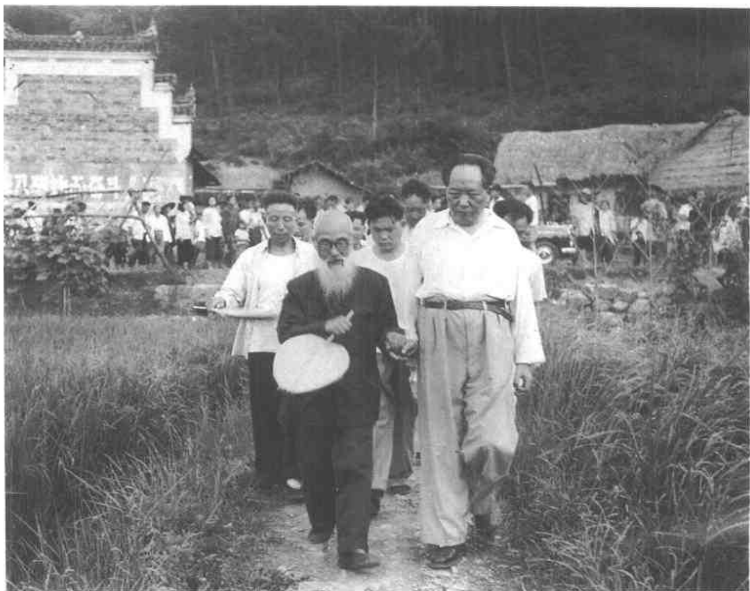
毛泽东在韶山。前排左一为毛宇居。(1959年)