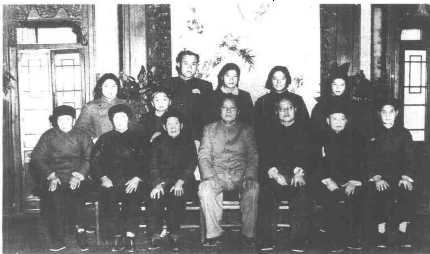
毛泽东和文家表兄嫂等合影。前排左起： 文南松妻刘氏、文运昌妻杨氏、表姐文静纯、 毛泽东、王季范、王季范妻萧氏、文津香儿 媳刘绶英。（1953年）