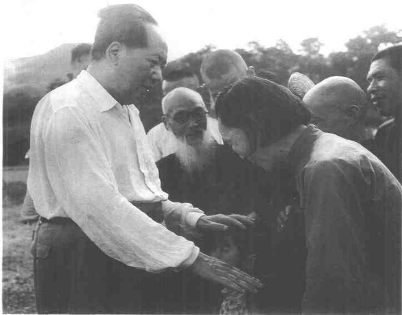
毛泽东和韶山亲友亲切交谈。(1959年)