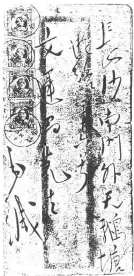
毛泽东给文运昌的信 (1937年11月)的手迹。