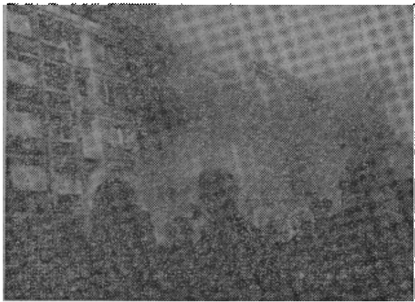
原图说明：十七日波兰什切青市警察总部大楼在焚毁。什切青是波兰因反涨价示威引起骚乱和纵火的四个城市之一。

西部城市克拉科夫发生一次和平示威。许多可靠人士还证实了在斯伍普斯克发生骚乱的消息。 不管政府怎样说，有迹象表明在格但斯克继续存在问题，可能是罢工。 【法新社华沙二十日电】据今天关于什切青骚乱的可靠报道说，有两股浪潮似的示威人群十七日涌向党部所在地士兵广场，抢劫并烧毁了这座建筑物。一股来自造船厂，另一股来自奥得河对岸的港口。他们冲破了企图阻止他们过桥的保安部队的封锁线。 示威者还用自制燃烧瓶烧毁了党的书记瓦拉舍克的别墅。当军队坦克开到士兵广场并向人群射击时，广场上拥满了示威者，据说很多青年被打死。