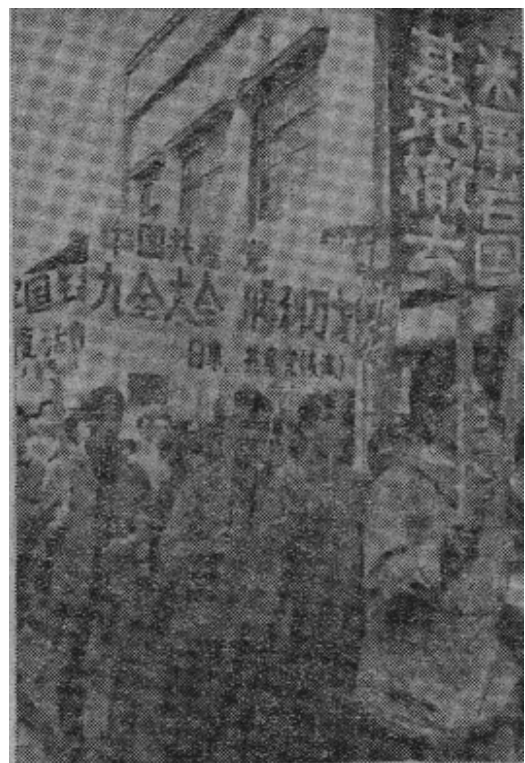
图片说明：四月二十七日日本山口县群众举行粉碎“安全条约”、撤除美军岩国基地、夺还冲绳的游行示威，许多工人和青年在游行时高举“中国共产党第九次代表大会胜利万岁”、“撤除美军岩国基地”等标语牌。