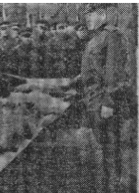
苏修侵捷之前曾在苏联西部边界举行一系列“军事演习”。左图为苏修军队士兵正进行“观察”，上图为苏修军官在谈后勤演习情况。