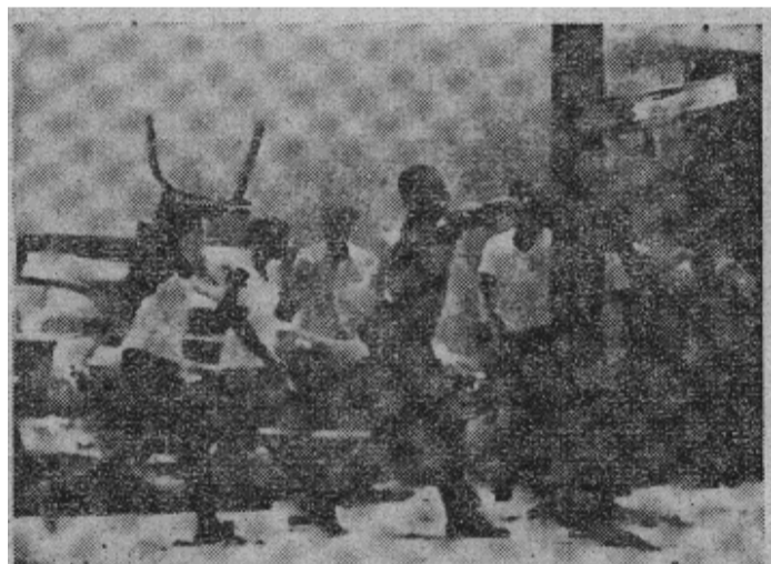
原图说明：八月八日迈阿密黑人区发生骚动时黑人暴动者投掷椅子。

——在政界：认为动乱的占百分之三十七，认为平静的占百分之三十七，不答复的占百分之二十六。