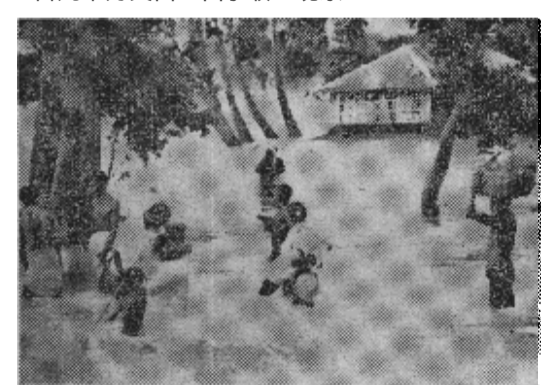
（合众国际社西孟加拉邦传真）印度东部在八月的第一个星期遇到最恶劣的雨季，难民们带着他们的财物在被洪水淹没的村庄里流浪前进。

据官方估计，到七月底仅有二百五十万亩插了秧，而通常插秧面积为四百七十万英亩，秋季早作物播种面积仅达七百七十万英亩，而通常应达一千一百九十万英亩。由于收