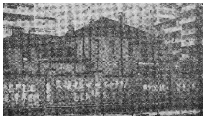
左图(右) 书写在墙壁上的大字标语