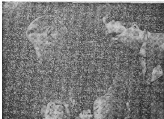
原图说明:国务卿腊斯克提前退出民主党纲领委员会会议,以核对苏军越过边界进入捷克斯洛伐克的消息。图为腊斯克(左)在退出会场前同委员会主席博格斯特悄悄说话。