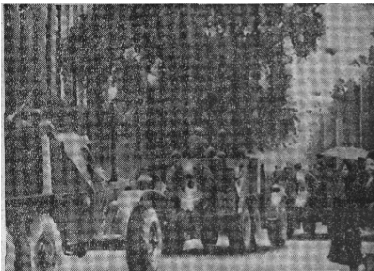
原图说明，捷克公民注视着苏联装甲车隆隆地驶过捷克斯洛伐克中央委员会大厦（图左）以完成二十一日清晨的包围。有消息报道，在黎明前，布拉格街道上，有小型武器和小型炮火的声音，有消息说，几人被打死，其中包括两名捷士兵被苏坦克压死。

【美新处联合国二十一日电】捷克斯洛伐克驻联合国代表团二十一日公布了捷克斯洛伐克外交部长于八月二十一日发表的声明。