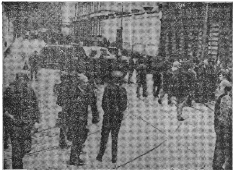
原图说明，华沙条约国军队开抵布拉格后，封锁了街道。

据捷克斯洛伐克驻萨格勒布总领事馆说，目前南斯拉夫有五万捷克斯洛伐克游览者。萨格勒布的市民邀请捷克斯洛伐克游览者免费住到他们家里去。