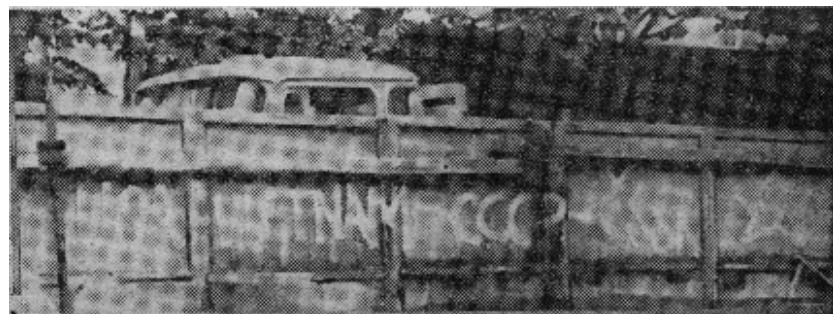
布拉格人民抗议苏修入侵，他们在墙上写大幅标语：美侵略等于苏侵略。