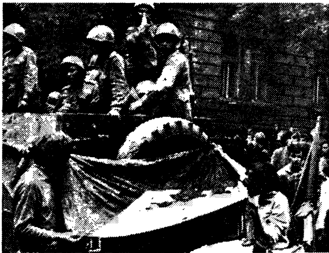
原图说明：捷克学生二十一日在布拉格向卡车上的苏联士兵展示血迹斑斑的国旗。

【德新社布拉格二十七日电】这里对今天发表的莫斯科会谈公报和斯沃博达总统的简短的广播讲话的