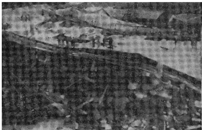
在馬尼拉二日发生的一系列地震中，一座高大的楼房（見左图）被震