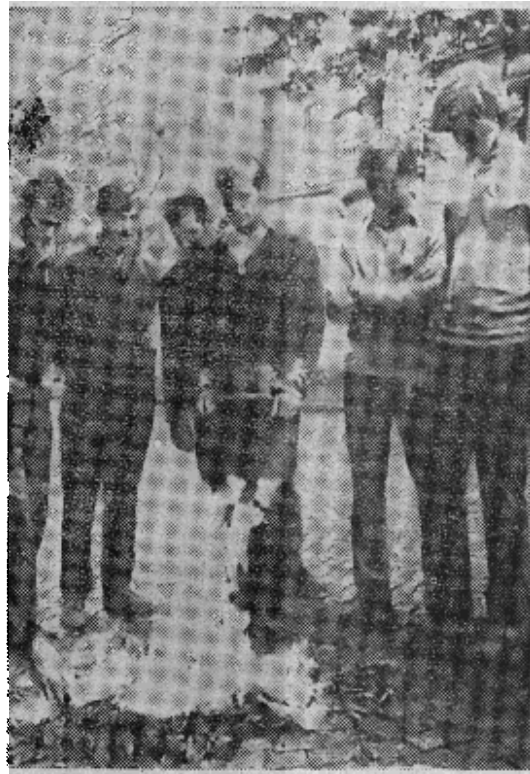
原图说明：年轻的捷克人在布拉格街上烧毁苏联直升飞机撒下的传单。