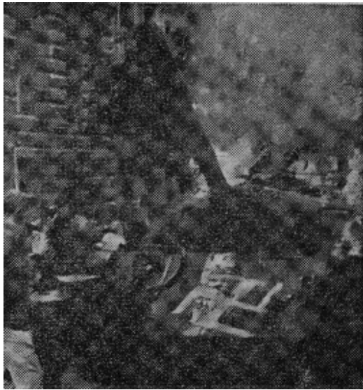
原图说明，在布拉格市中心广播电台附近的苏联坦克被涂上罐。