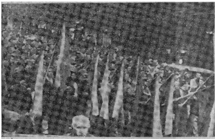
原图说明：年轻的捷克人在布拉格街上烧毁苏联直升飞机撒下的传单。

苏共、因而也是苏联成为进步力量和共产主义动力的神话破产了。使莫斯科成为主子的‘民主集中’，于一九六八年八月二十一日在布拉格被判处死刑。”