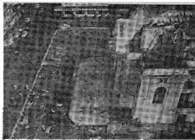
位于西贡南区的越南国会大厦的屋顶，被一支火箭掀掉了一部分，屋顶的碎块散落在市中心的街道上。