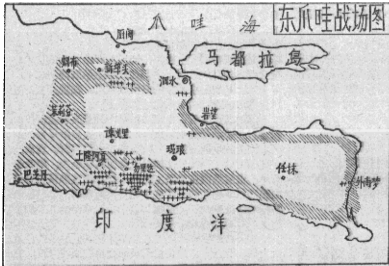
原图说明：图中斜线是印尼共活动线，是农村圈。在泗水（市内）有内部配合的运动，马都拉暂时让其“沉默”。危险还摆在我们面前。（原载印尼《卡米报》）

四月十八日，由来自泗水的军区官员主持，在勿里达召开了治安联席会议。当晚在勿里达北部，九名武装人员抢劫了锡多穆尔约的巫士和村长的财产，然后把他们枪杀了。继这个挑战之后，四月的最后一个星期又出现了第二次挑战，即在大白天，三名印尼武装部队成员被砍死，而在不远处，突击部队正在进行战斗演习。