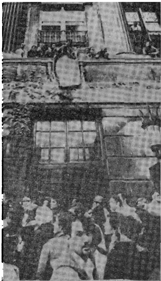
哥伦比亚大学学生占领了该校汉密尔顿大厅，并把教务长柯尔曼扣留在里面。图为学生们包围汉密尔

美宣布在伦敦抓到刺杀马丁·路德·金的凶手 【合众国际社华盛顿八日电】司法部的雷今天被伦敦警察厅的侦探在伦敦的紧的追捕使自金遇刺以来开始的六天的紧张的追捕告一结束