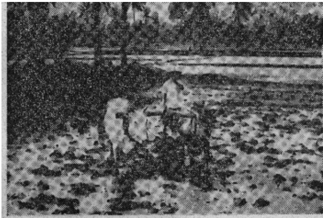
农村一片贫瘠景象。（原载《美国新闻与世界报道》）