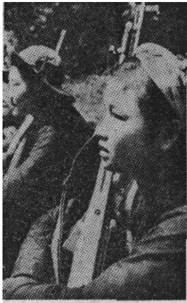
← 站在被打翻的美国 M-113 装甲车上的越共。