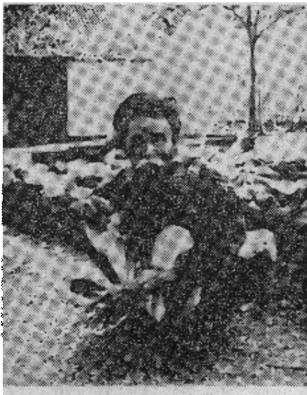
老农。饥饿、失业普遍。这是一个生活无着，骨瘦如柴的（原载《美国新闻与世界报道》）

交通运输是一件令人望而生畏的事情。从苏门答腊的顶端到西伊里安同澳大利亚所辖的巴布亚交界处的路程，则比纽约到旧金山的路程还远。只有一个岛屿（爪哇）有一条全天候公路连接它的主要城市。只有两个岛屿（爪哇和巴厘）之间有