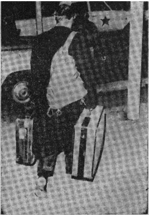
原图说明：国防部长麦克纳马拉在担任了这个国家最棘手的职务七年之后，自己提着行李，背着滑雪装备离开丹佛机场，他前往科罗拉多州休假一个月，再去世界银行就任新职。

【合众国际社华盛顿二月二十八日电】今天在白宫为麦克纳马拉的离职举行仪式时，麦克纳马拉抑制不住自己的感情。约翰逊总统授予麦克纳马拉自由勋章——美国的最高文职人员勋章，并对他大加赞扬。 【路透社华盛顿二月二十八日电】麦克纳马拉首先制订的政策（在欧洲作出灵活反应，在越南发动大规模进攻）和他为了执行这种政策而设置的计算机仍然存在，而成为历史上最大规模的扩大军事力量的作法的象征。 五角大楼的老资格的人物相信，事情决不会再同过去一样了。 麦克纳马拉的继任者更多地带有传统主义者的色彩，更多地带有约翰逊型的强悍的政治组织者的色彩。 他说他在一切关键问题上的想法都是同总统的想法一致的。 这位和蔼，文雅的新部长最初以在越南问题上主张强硬路线闻名，甚至是一个“鹰派”，这些人担心麦克纳马拉的离职将使将军们可以为所欲为。 【美新处得克萨斯州奥斯丁二月二十三日电】约翰逊总统今天任命已经退休的泰勒将军担任总统的对外情报咨询委员会主席。泰勒将军是接替克利福德的，克利福德辞去了该委员会主席职务，而接受了国防部长的职位。这位将军的任命将从克利福德宣誓就任国防部长之日起生效。 现任国防部长麦克纳马拉的辞职将于二月二十九日起生效。