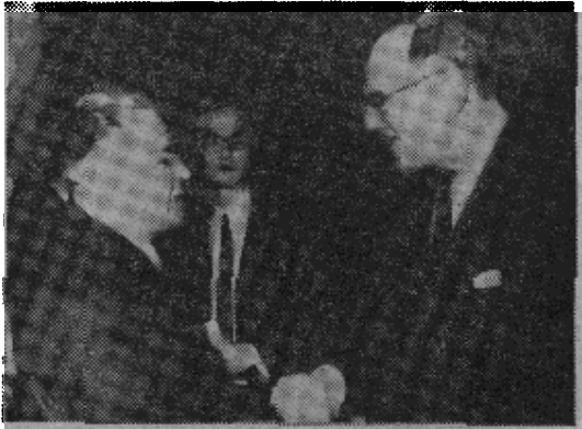
原图说明：苏联裁军谈判代表罗申（左）和美国谈判代表费希尔一月十八日共同提出防止核扩散条约草案后握手言欢。

【合众国际社汉城十九日电】南朝鲜政府今天在原则上欢迎美国和苏联一致同意的不扩散核武器条约。