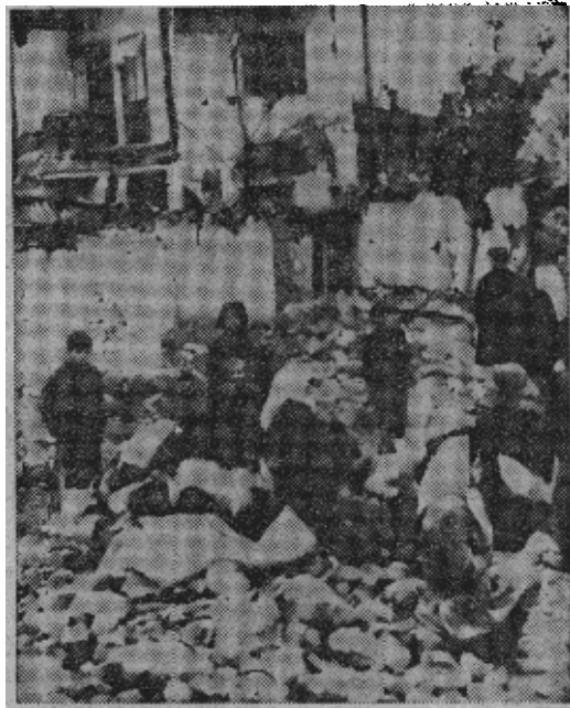
原图说明：在（南斯拉夫）德巴尔十一月三十日发生的地震后，父母和孩子们坐在他们的被毁的房子前的瓦砾中。