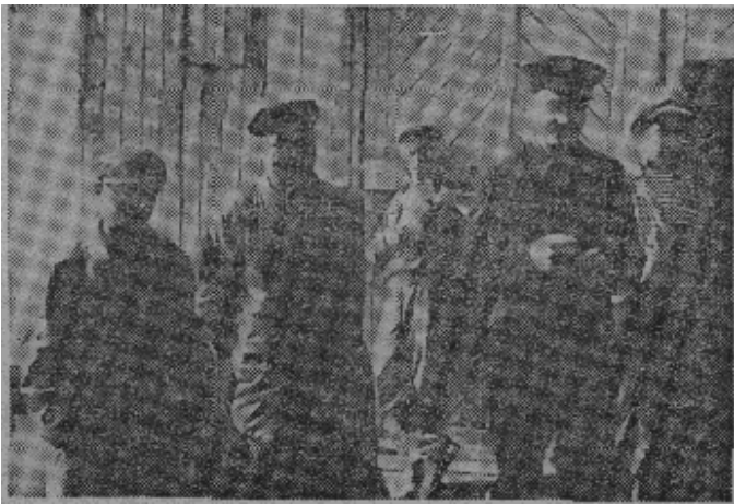
原图说明：据英国统计数字，苏联没有工作的人总数达一千四百万，据估计，其中不到一半能在工业部门找到工作