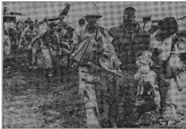
原圖片說明：從八七五高地撤下的傷兵精疲力竭地走向德都的野戰醫院。