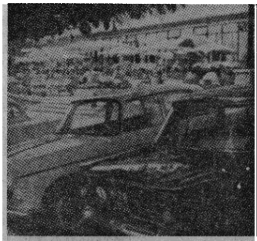
原图说明：近一半到黑海滨来的游客是西方人，他们的汽车停在大旅馆前面。

每一批东德游客都有一“旅行领袖”率领。如果团体中有任何人逃跑，这个旅行领袖就要被撤换，失去免费度假的权利，因此，他负有密切看守每个人的责任。