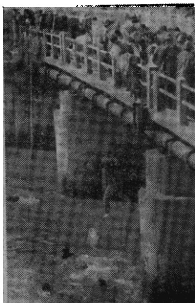
【合众国际社东京八日传真】全学联的示威者由于镇暴警察用催泪弹来驱散他们，在羽田国际机场附近的桥上跳下河去。全学联今天上午在机场周围集会，制止佐藤首相去东南亚。