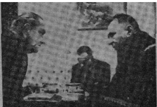
柯西金同約翰遜会谈时丑态

很难立即对刚刚举行的葛拉斯堡罗会谈的结果发表评论。然而，在目前情况下，没有任何东西可以使人认为，这一方或另一方进行了任何逼迫或威