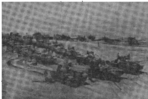
中东通讯社西奈传真图片说明，阿联在西奈的武装部队在去面临被占领的巴勒斯坦前线的途中。

此外，哈伊姆·赫尔佐克星期二晚宣布攻占耶路撒冷时暗示，以色列可能提出对约旦以西的约旦领土的要求。他说，以色列决心纠正约旦西岸停战分界线的“令人不能容忍的局面”。