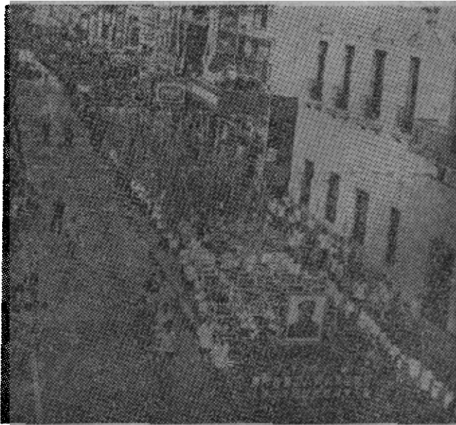
呼，澳門八千人集会后并举行环市示威游行，群众高呼：「打倒美英帝国主义！」「港英必败，港九同胞必胜！」「澳門同胞誓为港九同胞后盾！」浩浩荡荡通过新馬路「市政厅」前。（原载六月十八日香港《文汇报》）

“同胞们！你们醒醒，你们的眼前可能有残暴队，可能有警棍，可是你们看到三十英里以外有什么？这里已经有三师解放军，还有装甲部队，白云机场的人民空军已经不准休假，珠江舰队已经调到虎门口，你们的眼光就是只看眼前几尺，为什么不看远三十里。”