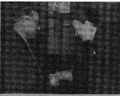
苏联最高苏维埃主席团副主席纳斯里金诺娃二月十六日在克里姆林宫欢迎以康良煜为首的朝鲜最高人民会议代表团。