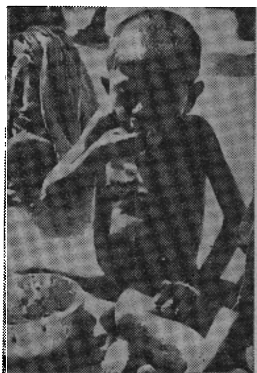
原图说明：饥饿的景象……照片中是一个四岁的儿童，在比哈尔邦救济委员会办的施饭处门口的景象。