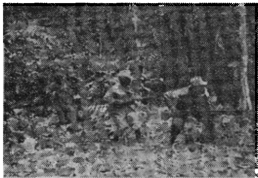
原图片说明：安哥拉人民解放运动的部队正在全国不同地区加紧活动（阿尔及利亚《圣战者日报》二月七日）

亚都没有正式承认他的运动，因此他此次旅行更加了不起。但是萨文比强调指出了这场战争的同生死共患难的性质。萨文比受过高等教育，表达力强，以前他是罗伯托的安哥拉人民联盟的总书记，在一九六四年他与罗伯托断绝了关系。 “我们没有现代装备。 至于通讯嘛，我们靠两条腿，这是最原始的，但是是有效的丛林电台。”葡萄牙人以减少税收来狡猾地对抗这个党对文盲农民进行的政治教育。它将是一场持久的战争。 萨文比说，“但是我们有了组织。我们的游击队不管到什么地方，消息都特别灵通。在我越过边界后的两个星期，葡萄牙人知道了我在安哥拉，我有一次差一点被捉住，但是幸运的是我们总是知道敌人在什么地方。” 这是十年来萨文比第一次访问他的祖国。但是他向我保证说，这远远不是他最后一次访问。