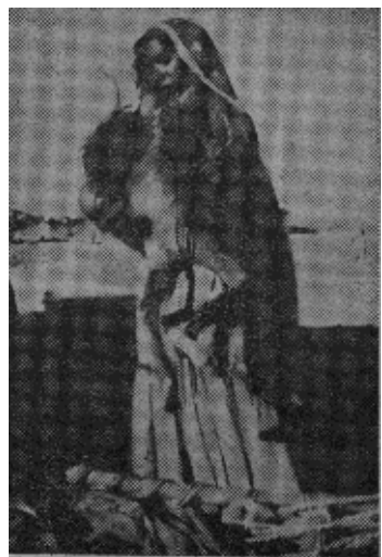
骨瘦如柴已两岁半的小孩（原载美【时代】周刊）