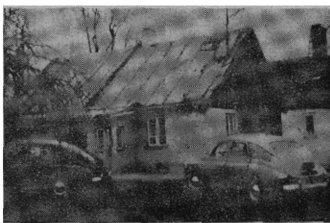
←这是一家富农的五幢华丽住宅中的一幢。