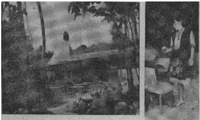
羊女服装的招待员 ← 黑海金沙滩「羊圈饭店」及宰牧