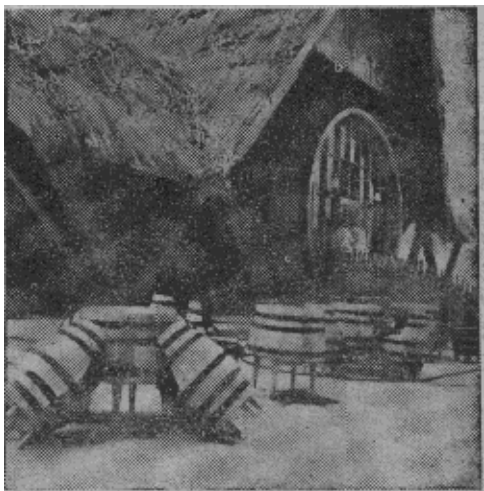
黑海太阳岸“酒桶饭店”的露天餐桌餐凳