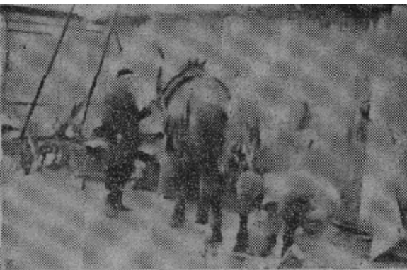
富农雇工普遍。这是一家富农的两个长工在干活。