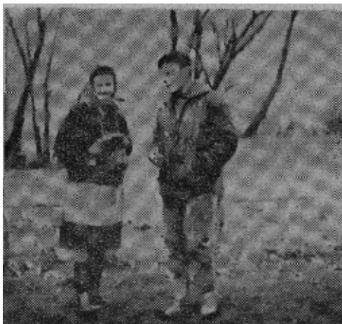
→ 这是一家富农夫妇,他们拥有二十多公顷土地。每年收入近百万兹罗提。女的手拿电影摄影机。