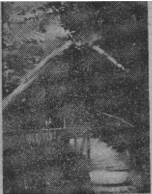
黑海边的“水上饭店”