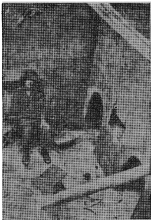
原图说明：在越共的小房子右侧看到的洞是象蜂窝一样的迷路的进口。在地道里发现了武器、粮食和弹药。

在地道中停留时间不能过久，因为氧气少，容易窒息。有些地方连打火机也打不着火，就是氧气少的证明。地洞的直径约在两英尺到两英尺半，四肢蜷伏在里面已经塞得满满的。里面没有支柱，纯粹是人挖出来的，洞里面还有许多奇形怪状的虫，蜈蚣，蝎子……比毒虫更使人害怕的是洞壁上一个个越共的手印，这些手印也许就是几秒钟以前越共留下的，一想到他们可能在地道中窥伺你时，你不战栗才怪呢！