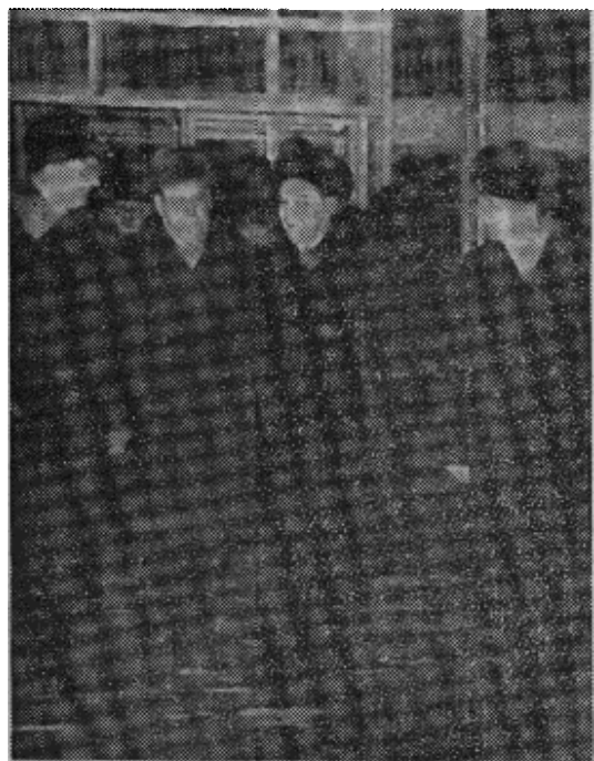
上图是塔斯社六日从莫斯科发出的传真图片，原说明为：“当以谢列平为首的苏联代表团今天清晨从这里动身前往河内的时候，苏斯洛夫、基里连科、谢列平和波利扬斯基（自左至右——本刊注）在伏努科夫机场上。”

他們希望謝列平已注意到美國昨天向聯合國表示過的相互減少敵對行動的意願，而且希望他會以蘇聯的力量支持全世界對北越施加壓力使它听取意見。