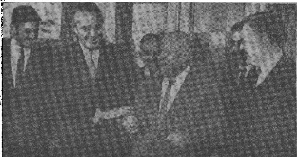
起凱眾在 美駐哈國 蘇大使里 科曼播 勒發(一) 譯員赫魯 曉夫和哈 里曼三國 禁核試 談判開 始前會 晤情況 的特別 照後排 右起黑 爾什姆 等七月 十二日 在克里 姆林宮 舉行

他发表了下列声明: “这是小组委员会将要举行的若干意见听取会之一,目的是为了深入地研究苏联和共产党中国之间的分裂的性质和意义。” “当然意识形态发生了分歧,但我认为还有历史和民族差异,经济和社会问题,军事因素及对目前世界局势的不同估计和解释,所有这一切都使两国关系更为复杂了。” “我们的主要注意力将集中在尚未进行充分探索或明确说明的因素上。今天的会议增进了对这些因素的了