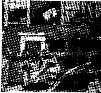
麦克米伦竞选情况 原载10月4日“星期日泰晤士报”

【路透社华盛顿9日电】白宫发言人哈格蒂今天说，艾森豪威尔总统已经致电麦克米伦向他祝贺在英国大选中取得胜利。