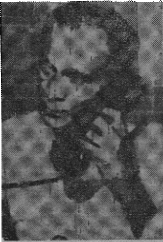
• 达哈納亞克 •

表明中国对西藏问题的看法的一本北京出版的书现在大量涌入中东许多地区。它有二百七十五页，插图很多，在这里卖的价钱连四个先令都不到。