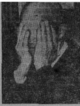
美总统艾森豪威尔在3月17日向全国发表电视演说前的一刹那。

艾森豪威尔就通货膨胀问题回答他的批评者说：“他们忘记了，到大雨如注时再修漏水的屋顶就太迟了。”他接着说：“现在正是考虑通货膨胀的时候了，因为我们可以肯定，这个问题是会回过头来缠绕我们的。只有运用最一贯的反压力才能使物价保持它们原来的水平。”