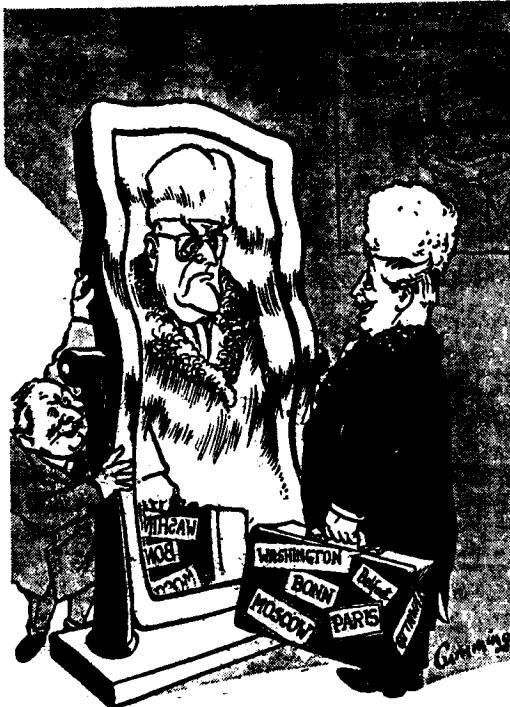
“One more air Journey, Harold, and Ike will think he's got Foster at his side once more.”

【本刊讯】3月18日英国“每日快报”刊载一幅漫画，讽刺麦克米伦步杜勒斯后尘最近接连不断地乘飞机到各国首都进行外交活动。图中站在穿衣镜前面的是麦克米伦，但是镜子里照出来的人像却是杜勒斯。麦克米伦的提箱上贴着许多旅行标签，上面写着“莫斯科”，“巴黎”，“波恩”，“华盛顿”，“培尔法斯特”和“渥太华”。给麦克米伦扶镜子的人说，“哈罗德（麦克米伦的名字），再飞一次，艾克就会以为福斯特（杜勒斯的名字，按杜勒斯现在还未复职）又在他身边了。”墙上挂的是艾森豪威尔的照片，上面写着“老大哥在向你微笑！”